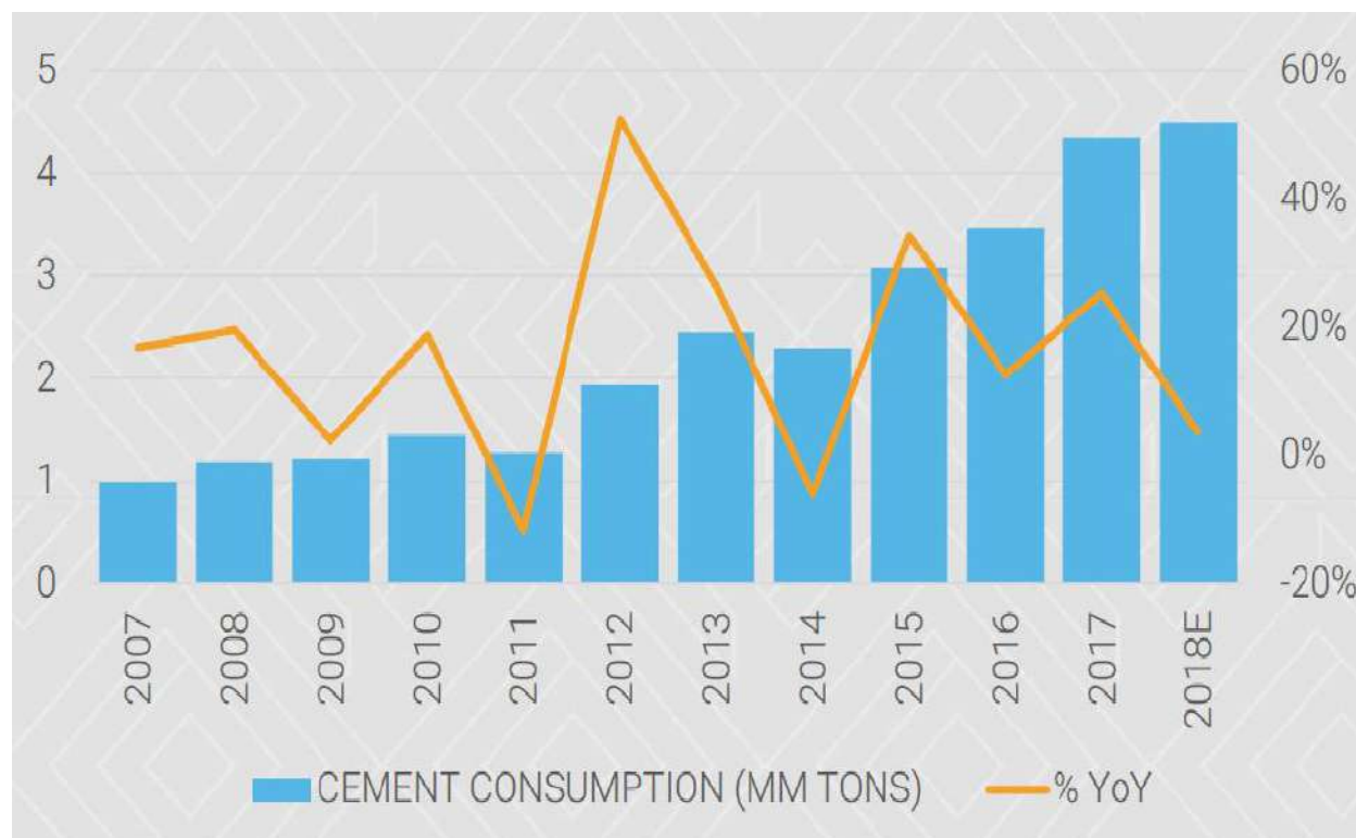
نمودار مصرف سیمان بین سال‌های ۲۰۰۷-۲۰۱۸

در ابتدا لازم است بدانیم طبق نمودار مصرف سیمان با توجه به عدم توانایی ساحل عاج در تأمین کلینکر وارداتی به مقدار کافی، تولید و عرضه سیمان به شکل غیرطبیعی در سطح پایین تری نسبت به تقاضای سیمان قرار می‌گیرد.