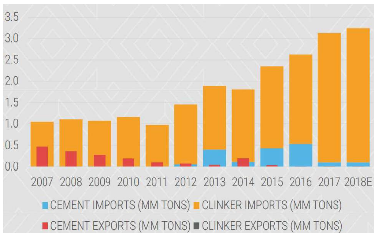
نمودار بازار واردات و صادرات کلینکر بین سال های ۲۰۰۷-۲۰۱۸

از سویی دیگر به دلیل نبود مواد خام مناسب (مانند آهک)، ساحل عاج به عنوان یک واردکننده محض کلینکر شناخته می شود. ساحل عاج طی سال های ۲۰۰۷ تا ۲۰۱۳، با در نظر گرفتن منطقه "Abidjan" به عنوان بندری با رتبه بالای ورود کالا، بیش از ۲۰ میلیون تن کلینکر وارد کرده است. ذکر این نکته بسیار مهم است که طی یک دهه اخیر، حدود ۸۵ درصد از تمام واردات کلینکر متعلق به هفت کشور اسپانیا (۲۲٪)، ژاپن (۱۴٪)، مراکش (۱۲٪)، یونان (۱۰٪)، پرتغال (۱۰٪)، کره جنوبی (۹٪) و ترکیه (۹٪) بوده است و این در حالی است که در این بین تنها ترکیه و ژاپن جز ۱۰ ظرفیت برتر تولید کلینکر در جهان هستند!